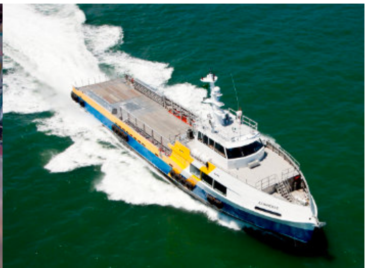
Fabricação de alta qualidade assegurada