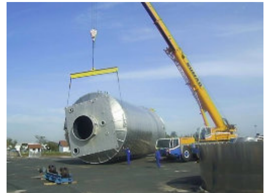
Procedimentos certificados, equipamentos e consumíveis rastreáveis