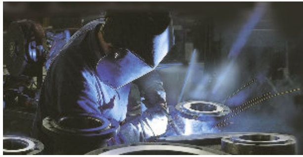
Soldagem de vaso de pressão na planta da Zeppelin Systems Welding on pressure vessel at Zeppelin Systems' plant Soldadura de estanque de presión en la fábrica de Zeppelin Systems