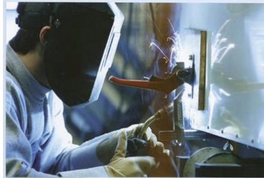
Soldadores qualificados / Skilled welders / Soldadores calificados