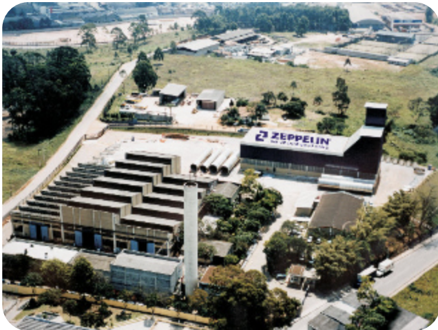
Vista aérea da fábrica Plant overview Vista aérea de la fábrica