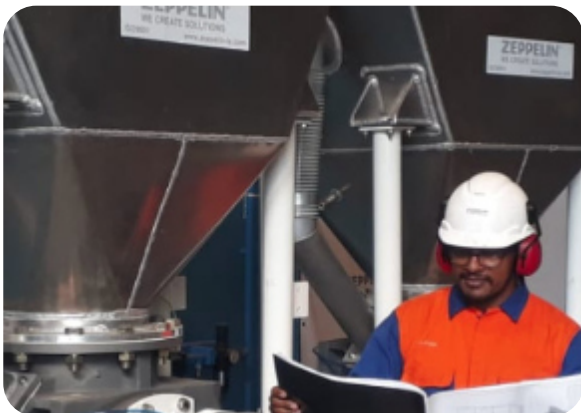
Mão-de-obra especializada Skilled personnel Mano de obra especializada