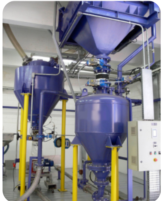
Centro de testes Test Center Centro tecnológico

ZEPPELIN SYSTEMS LATIN AMERICA EQUIP. IND. LTDA