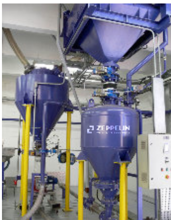
Centro de Testes / Test Center Centro tecnológico