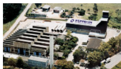
Vista aérea da fábrica / Plant overview Vista aérea de la fábrica