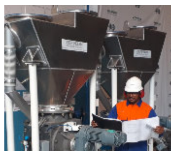
Mão-de-obra especializada Skilled personnel / Mano de obra especializada